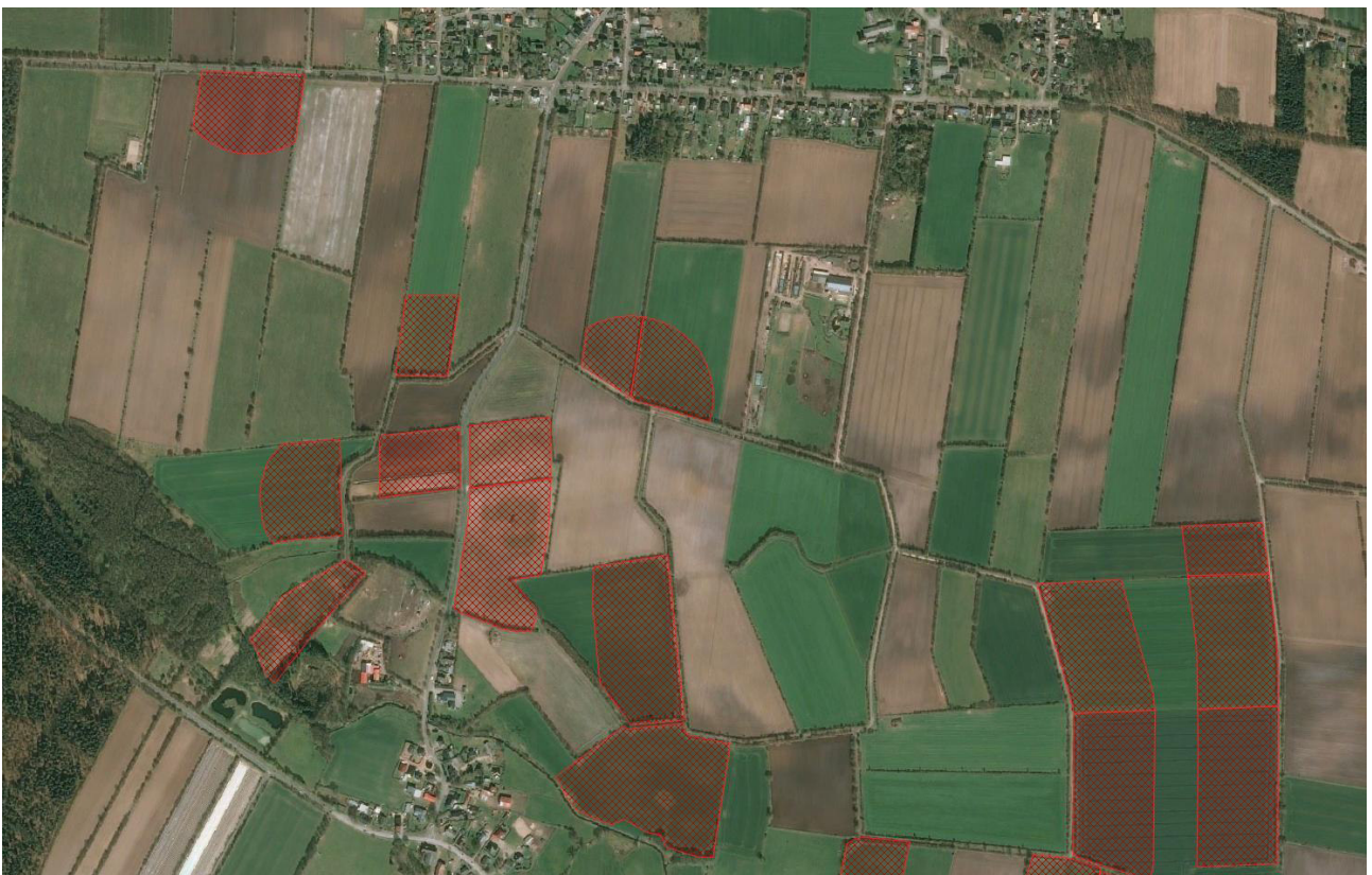
Abbildung 2: Beispiel für ein Referenzgebiet mit Streifen- und Halbkreis-Taxationsflächen ( ST_{Circplot} ) (erstellt von H. Schmäuser, Schleswig-Holstein)